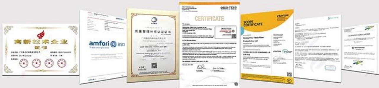
NATIONAL HIGH-TECH ENTERPRISE certificate