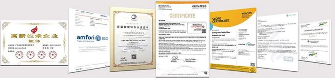
NATIONAL HIGH-TECH ENTERPRISE certificate Business Social Compliance Initiative (BSCI) certification ISO9001 Quality Management System Certification Confidence in textiles OEKO-TEX standard 100 certification Global Recycling Standard (GRS) certificate Dupont™ Sorona® Common Thread certification Germany Cell Solution® CLIMA fiber authorization