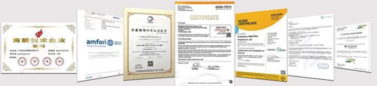
NATIONAL HIGH-TECH ENTERPRISE certificate