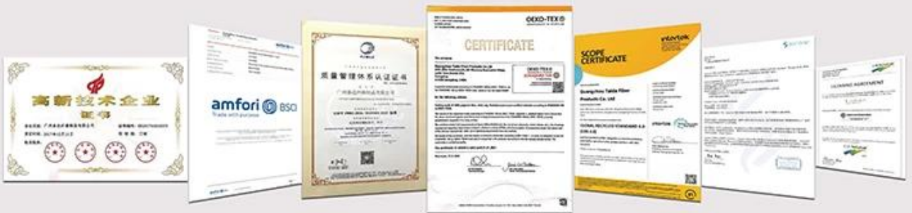
NATIONAL HIGH-TECH ENTERPRISE certificate | Business Social Compliance Initiative (BSCI) certification | ISO9001 Quality Management System Certification | Confidence in textiles OEKO-TEX standard 100 certification | Global Recycling Standard (GRS) certificate | Dupont™ Sorona® Common Thread certification | Germany Cell Solution® CLIMA fiber authorization