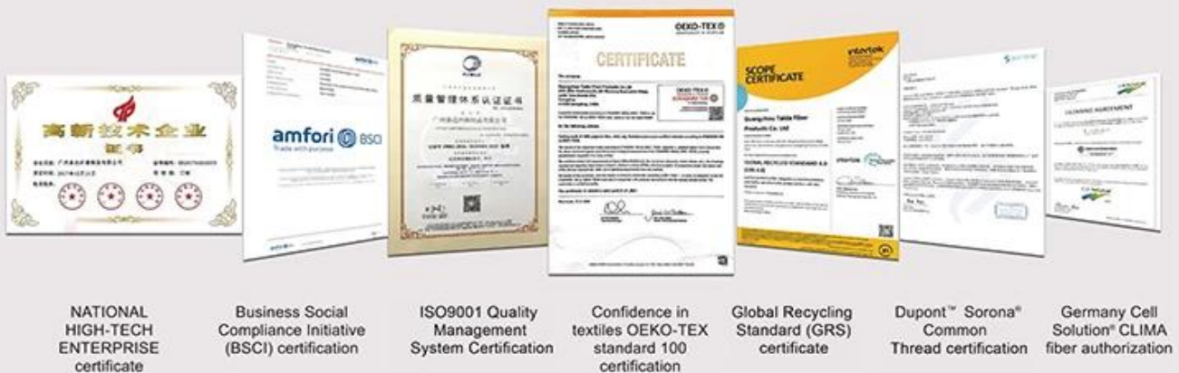
NATIONAL HIGH-TECH ENTERPRISE certificate