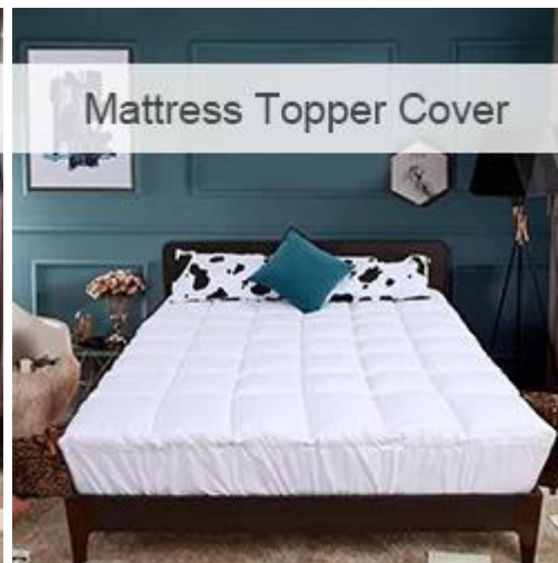
Mattress Topper Cover