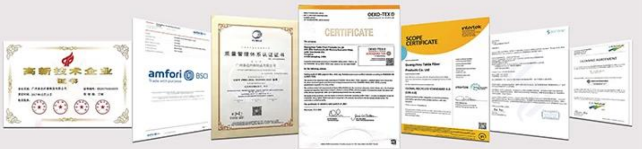
NATIONAL HIGH-TECH ENTERPRISE certificate