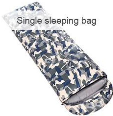
Single sleeping bag