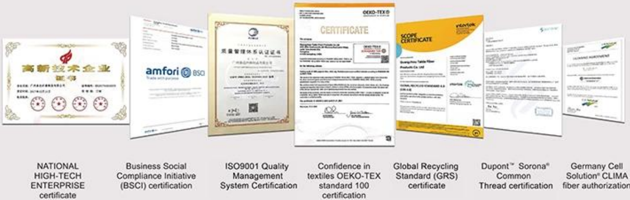
NATIONAL HIGH-TECH ENTERPRISE certificate