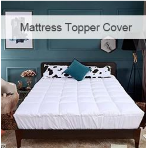
Mattress Topper Cover