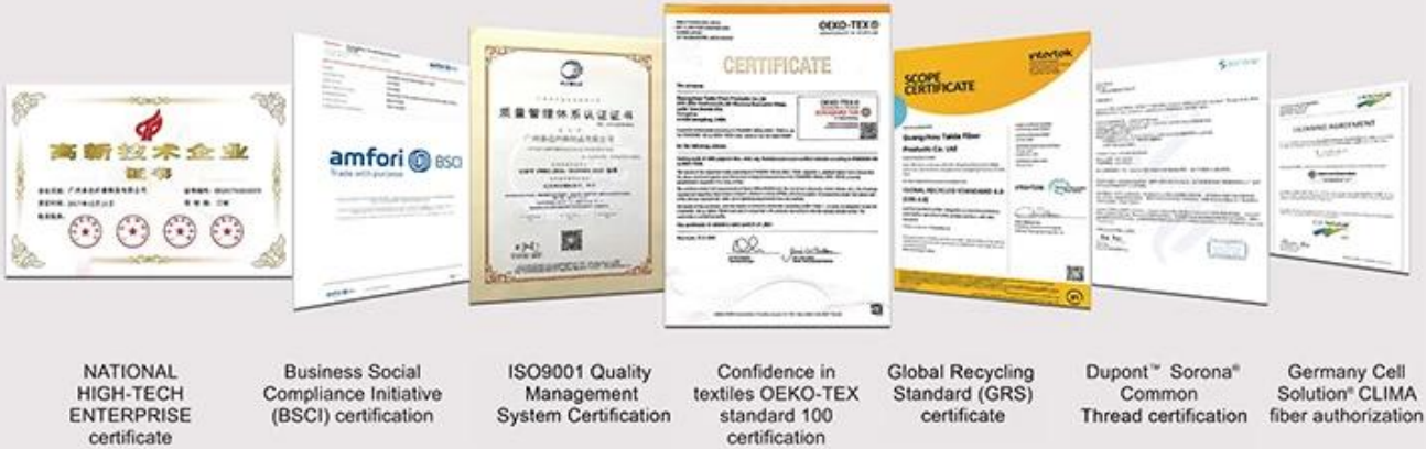
NATIONAL HIGH-TECH ENTERPRISE certificate