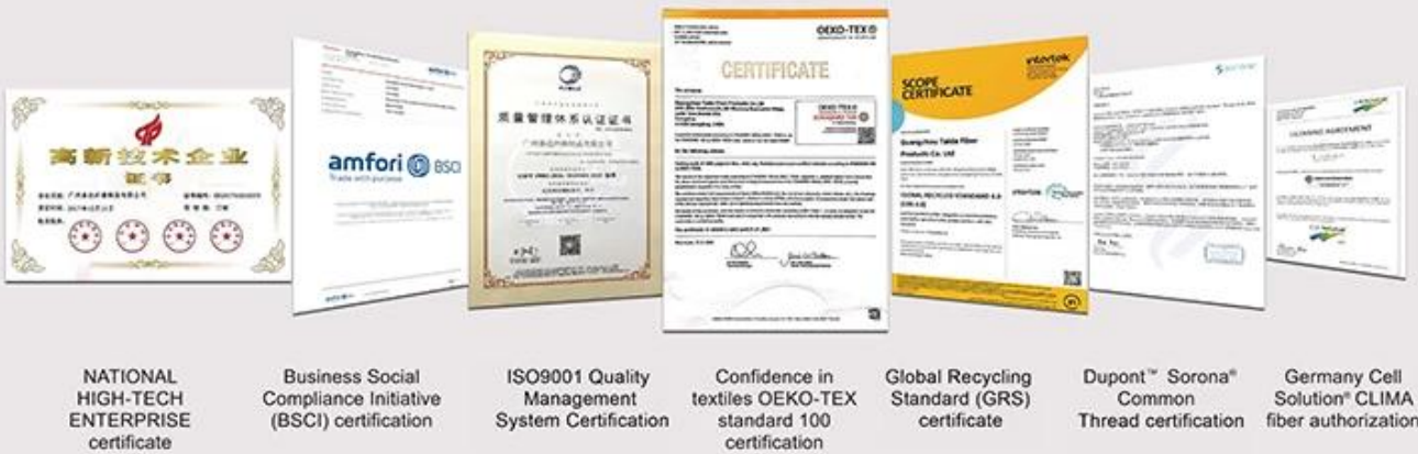
NATIONAL HIGH-TECH ENTERPRISE certificate