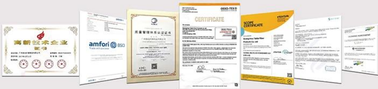
NATIONAL HIGH-TECH ENTERPRISE certificate