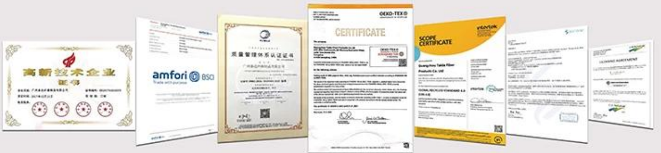
NATIONAL HIGH-TECH ENTERPRISE certificate