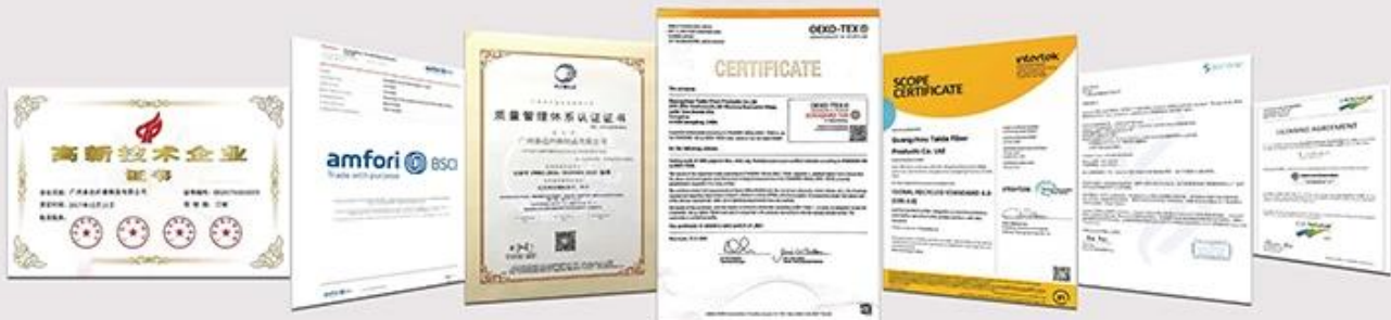
NATIONAL HIGH-TECH ENTERPRISE certificate