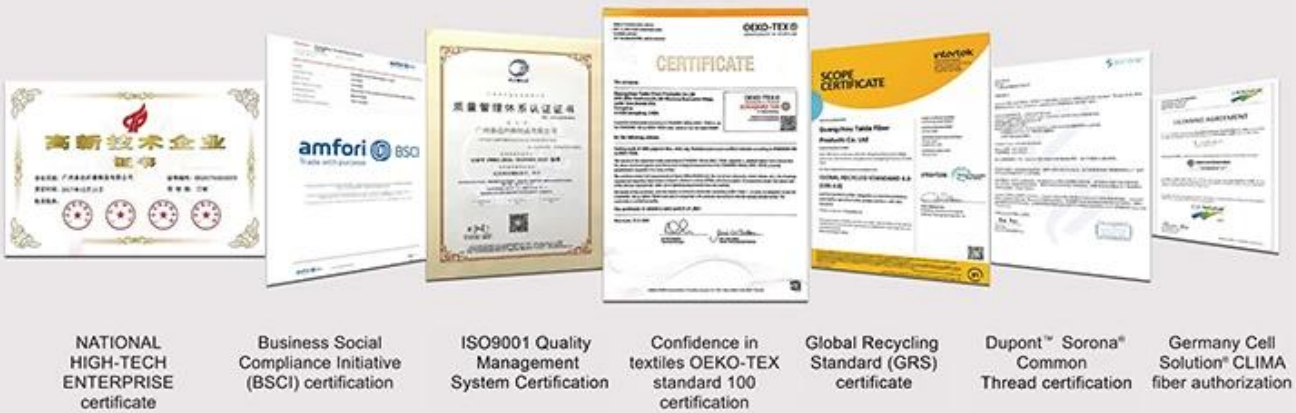
NATIONAL HIGH-TECH ENTERPRISE certificate