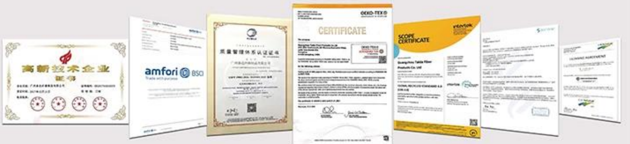
NATIONAL HIGH-TECH ENTERPRISE certificate